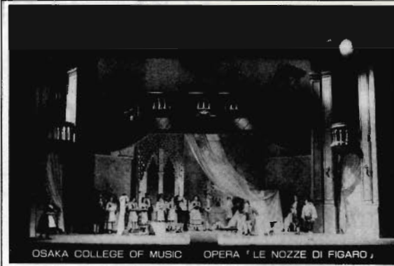
OSAKA COLLEGE OF MUSIC OPERA 'LE NOZZE DI FIGARO'