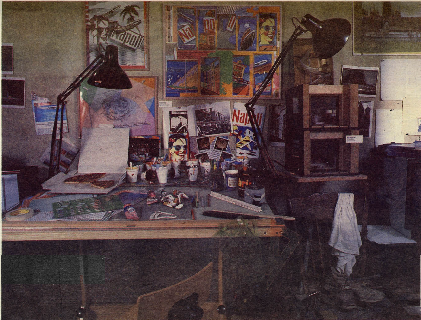
Expozice Spojených států amerických na PQ '87.