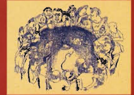
„L'Entresort“ (Studna) divák se ocitá na kruhové lávce