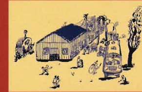
„La Baraque“ (Bouda) - víno, puševka, hudba Volière Dromesco a Bratři Formani

Doprovodné akce se stanou poprvé důležitou součástí světové výstavy a svým živým charakterem umožní zprostředkovat scénografii co nejširším vrstvám návštěvníků. Je přitom kladen důraz na takové projekty, které svou výtvarnou a vizuální složkou ožívují a rozvíjí jednotlivé scénografické instalace.