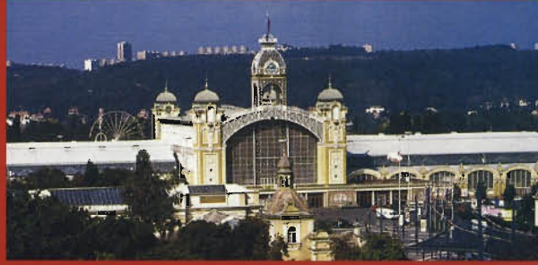
Výstaviště Praha / Průmyslový palác a venkovní prostory

Argentina / Austrálie / Belgie / Bělorusko / Bulharsko Brazílie / Česká republika / Čína / Dánsko / Egypt / Estonsko Finsko / Francie / Hong Kong - Čína / Chile / Chorvatsko Island / Itálie / Izrael / Japonsko / Jihoafrická republika Jugoslávie / Kanada / Korea / Kuba / Kypr / Litva Lotyšsko / Mexiko / Maďarsko / Německo / Nizozemí Norsko / Nový Zéland / Peru / Polsko / Portugalsko Rakousko Rusko / Rumunsko / Řecko / Slovensko Slovinsko / USA / Sýrie / Španělsko / Švédsko / Švýcarsko Velká Británie / Venezuela