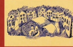
„La Tente“ (Stan) plátěný stan divadla Theatre du Radeau