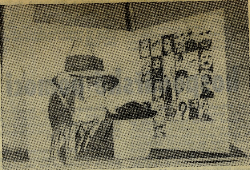
SCÉNICKÝ NÁVRH uruguayských výtvarníků ke kolektivní inscenaci tvůrčí skupiny M. A. G. Šepot