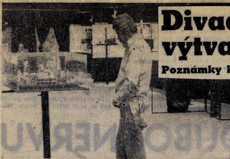
Pohled do expozice Velké Británie, která získala Zlatou trigu.

BRUSELSKÝ PAVILÓN v Parku kultury a oddechu J. Fučíka v Praze se stal opět po čtyřech letech dostavníčkem jevištních výtvarníků a architektů z celého světa. Do konce června si zde můžeme prohlédnout práce těch, kteří své tvůrčí síly věnují výtvarnému vyjádření jak dramatického odkazu klasiků, tak současných snah o zachycení našeho života. V soutěžní kolekci předkládají návrhy scén a kostýmů ve fotografiích, kresbách, náčrtech, malbách, kolážích i maketách výtvarníci z 19 zemí světa.