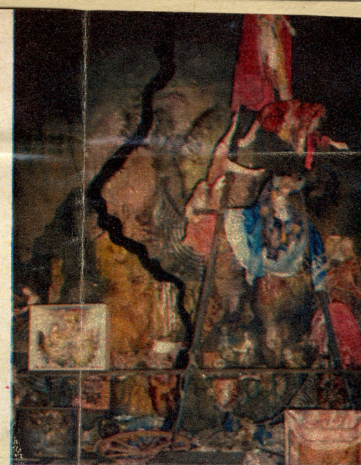
SOUBOR POLSKÉ EXPOZICE Z NÁVRHŮ PRO DIVADLO V GDAŇSKU (SCÉNOGRAF MARIAN KOŁODZIEJ)