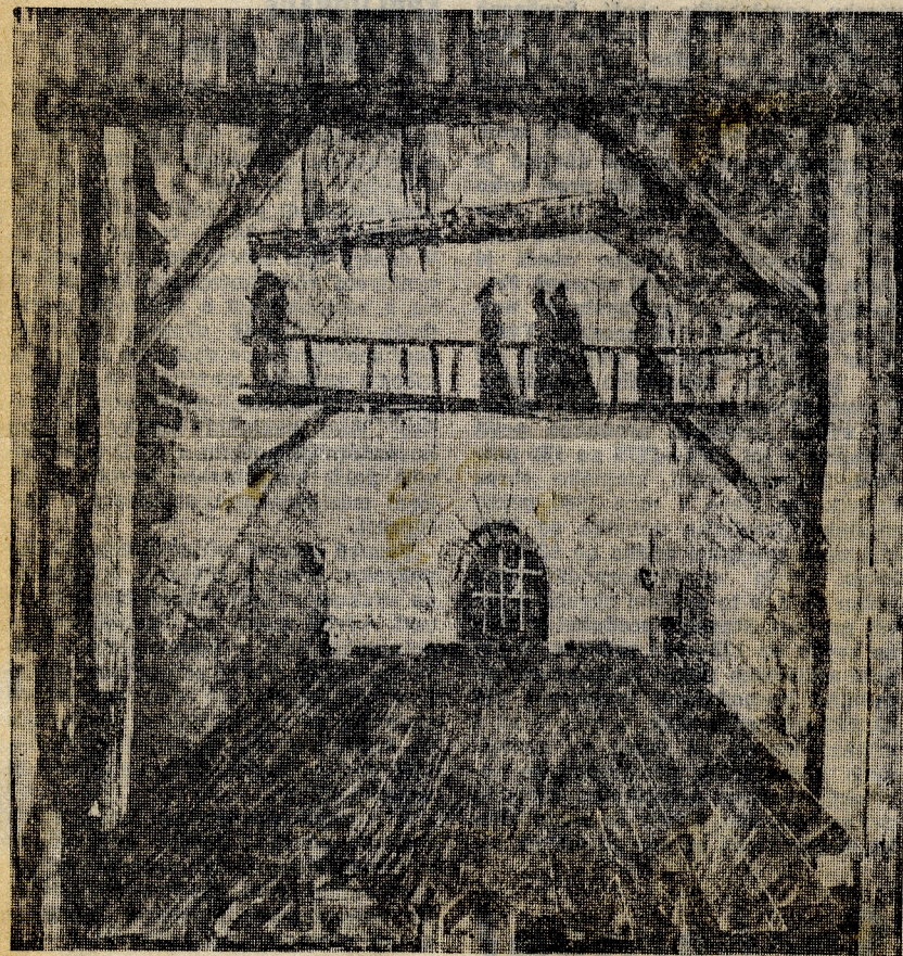
E. Stenberg: Muž zvaný La Mancha.